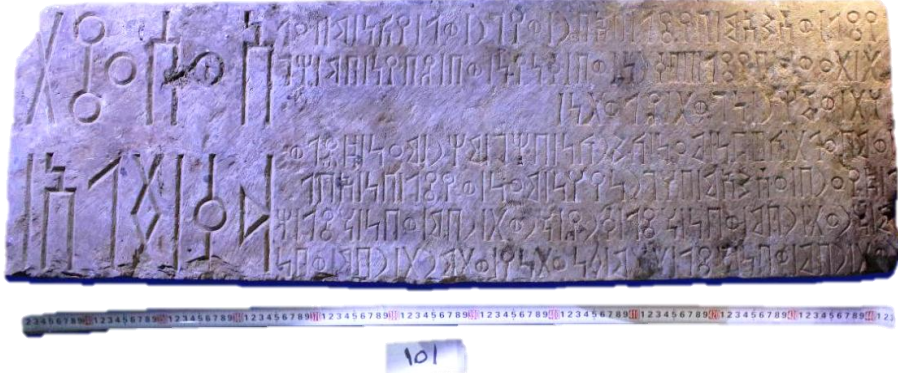
لوحة ٤: هديل - معين ٤ (Had - Ma'in 4)