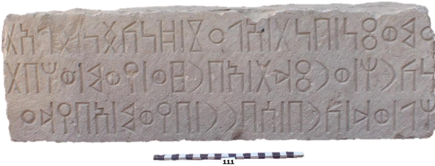
لوحة ١: هديل - معين ١ (Had - Ma'in 1)